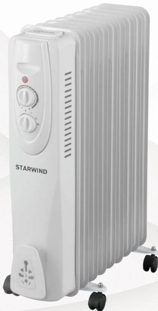
Радиатор масляный SHV3915