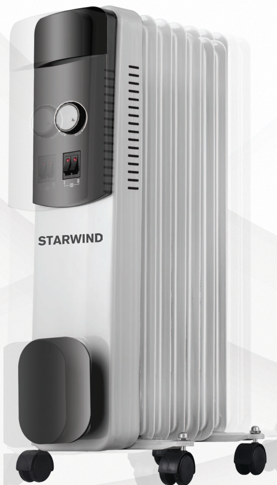
Радиатор масляный SHV4710