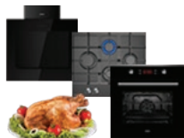
Встраиваемая техника Воздухоочистители (вытяжки) Варочные поверхности Духовые шкафы

Мы рады предложить Вам другие продукты торговой марки «AVEX», среди которых: