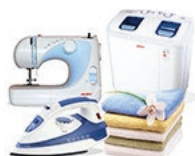
Техника для дома Стиральные машины Швейные машины Оверлоки Утюги, Отпариватели