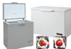
Торговое оборудование: Морозильные лари