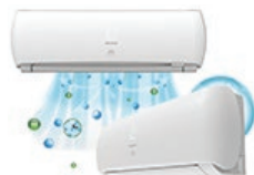
Климатическая техника Сплит-системы Оконные кондиционеры