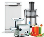
Техника для кухни: Холодильники Морозильники Посудомоечные машины Плиты газовые Микроволновые печи СВЧ Диспенсеры Настольные духовки Мясорубки Соковыжималки