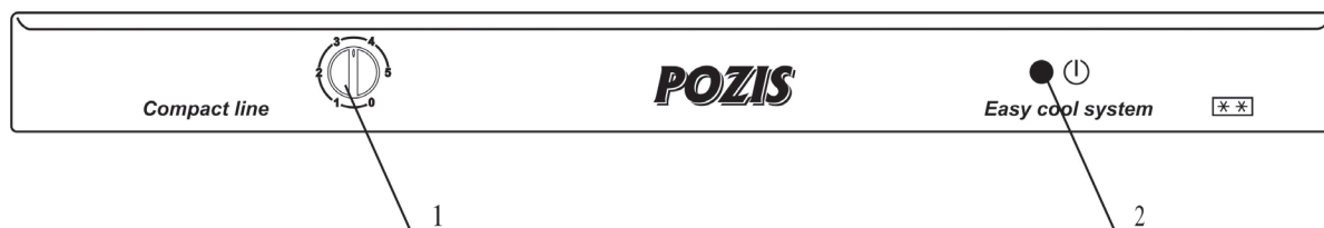
Рис.2 Регулировка температурного режима 1 – ручка терморегулятора 2 – индикаторная лампа (сеть)

После выхода в режим ручку терморегулятора переведите в положение «3». В процессе эксплуатации Вы можете регулировать температуру следующим образом: при чрезмерном охлаждении продуктов в холодильной камере ручку терморегулятора поверните против часовой стрелки, при недостаточном охлаждении - по часовой стрелке.