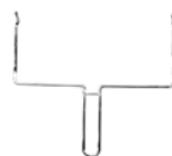
Ухват для вертела