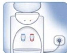
6. Включите кулер в сеть