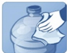
1. Протрите бутылку перед установкой

Аппарат следует устанавливать на ровной, прочной поверхности, расстояние между стеной и аппаратом должно быть не менее 15 см. Не устанавливайте аппарат вблизи нагревательных и отопительных приборов. Защищайте аппарат от прямого попадания солнечных лучей. Не размещайте аппарат в сыром помещении.