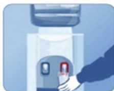
5. Держите кран нажатым, пока не потечет вода