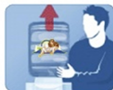
3. Поверните бутылку горлышком вниз