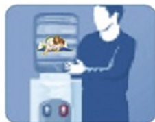
4. Установите бутылку сверху на кулер строго вертикально