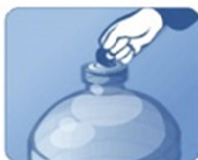
2. Снимите защитный ярлык с пробки