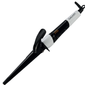
GL4614 ПЛОЙКА КОНУСНАЯ