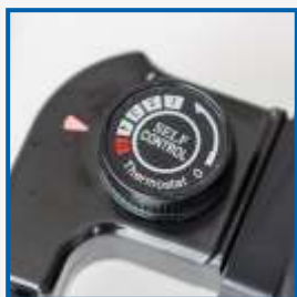
Терморегулятор позволяет плавно изменять температуру приготовления пищи