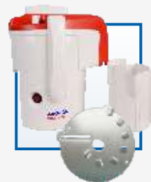
Соковыжималка СЦ32.02 «Джус»

В комплекте двусторонний диск для шинкования и резки ломтиками, стакан для сока