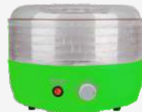
Разнообразие цветовых решений