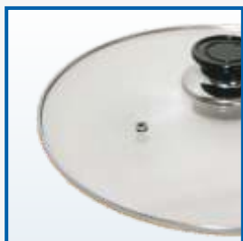
Прозрачная крышка из жаропрочного стекла