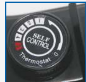
Терморегулятор позволяет плавно изменять температуру приготовления пищи