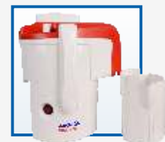
Соковыжималка СЦ32.01 «Джус»