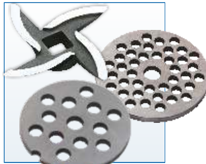
Комплект решеток из нержавеющей стали с отверстием диаметром 4,9 мм, 7 мм и нож с саблевидной режущей кромкой.