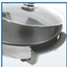
В процессе приготовления ручки не нагреваются.