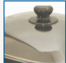
Прозрачная крышка из жаропрочного стекла