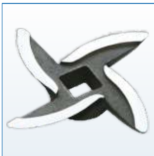
Нож с саблевидной режущей кромкой.