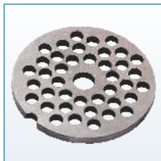
Решетка из нержавеющей стали с отверстием диаметром 4,9 мм.

Защитный экран собственной разработки сохранит чистоту на кухне. Подходит к мясорубкам «Аксион» серии M12, M14, M21, M25, M31, M32, M33, M34, M35, M42, а так же к электромясорубкам других марок с аналогичными размерами.