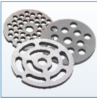
Комплект решеток из нержавеющей стали с отверстиями диаметром 4,9 мм, 7 мм, овальными отверстиями.