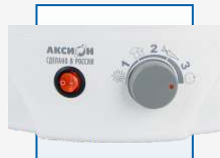
Регулировка температуры сушки