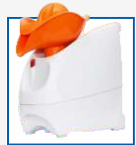
Соковыжималка для цитрусовых