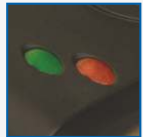
Световой индикатор температуры и режима