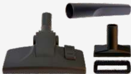
Щетка для пола, насадка для мебели со вставкой для чистки одежды, щелевая насадка