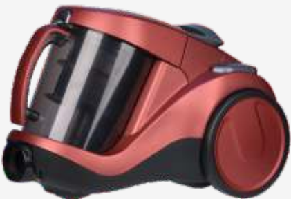
Цветовые варианты Р36 и Р37