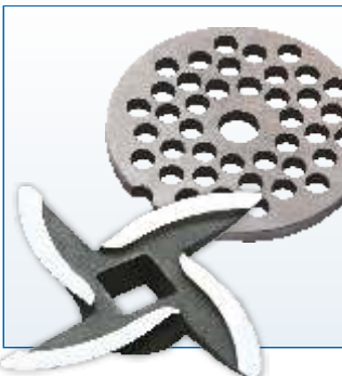
Комплект: решетка из нержавеющей стали с отверстиями диаметром 4,9 мм и нож с саблевидной режущей кромкой.